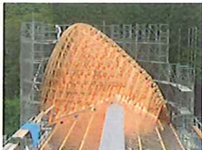
木造シェル組立工事