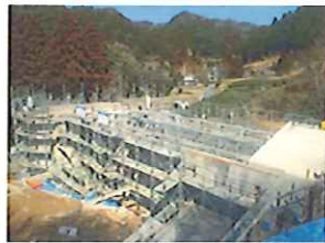
壁式鉄筋コンクリートによる躯体工事