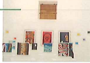
館内には多くの子どもたちの作品が飾られています