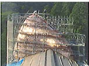
藤森葺き銅板工事