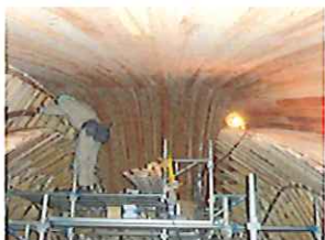
内装屋根木下地工事