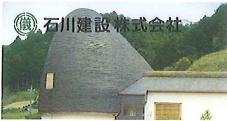
“手もみ銅板”をこけら状に葺いた屋根。銅板の手もみ作業は、学園の子どもたちと職員が行いました。