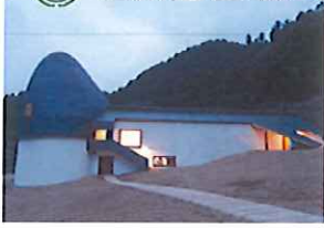
館内からこぼれる明かりの中にとたずむ、ねむの木こども美術館