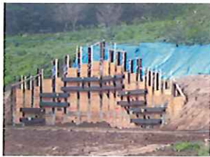
建築物と直接接する南側の山際斜面の土留め工事