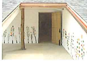
外壁の麦の穂の絵はねむの木学園の子どもたちによって描かれたものです